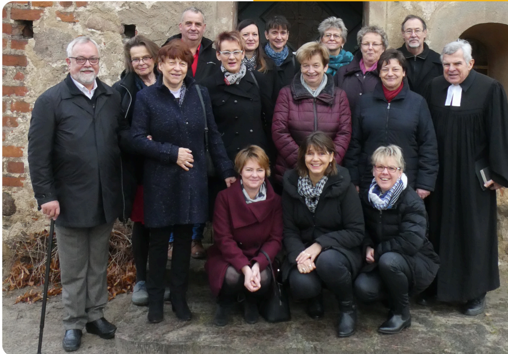
Der aktuelle Gemeindegkirchenrat wurde am 24. November 2019 gewählt.